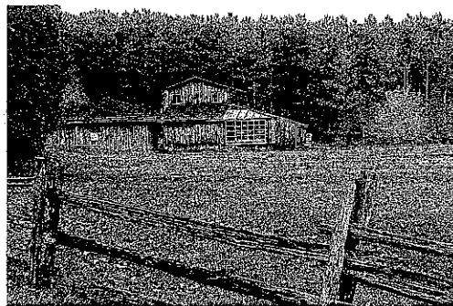
Paisajes como este abundan en Ontario, Canadá.

comerciales como Vaughan Mills ubicado a media hora de Toronto, a precios más accesibles que en Nueva York y con las mismas marcas que en Estados Unidos