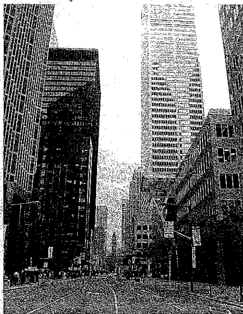
Toronto, una ciudad moderna y vibrante, puerta de entrada a Canadá