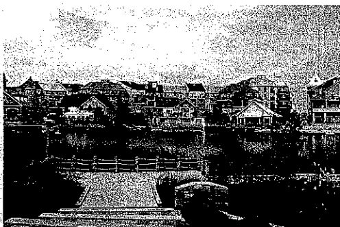
Collingwood cerca de Blue Mountain, ideal para vacacionar en cualquier época del año.